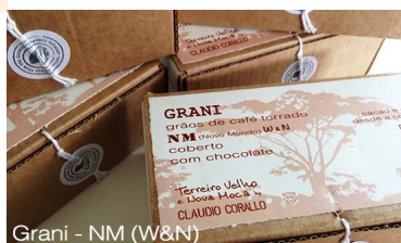
Grani - NM (W&N)