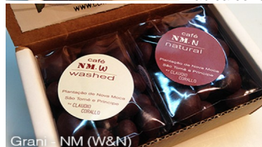
Grani - NM (W&N)