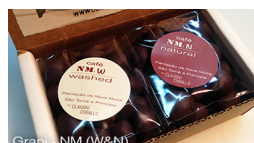
Grani - NM (W&N)