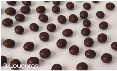
Roasted coffee beans covered with 55% chocolate